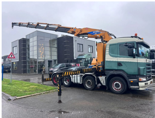
Scania R124-420 8X4 EURO 3 + EFFER 950/6S + 1 + REMOTE