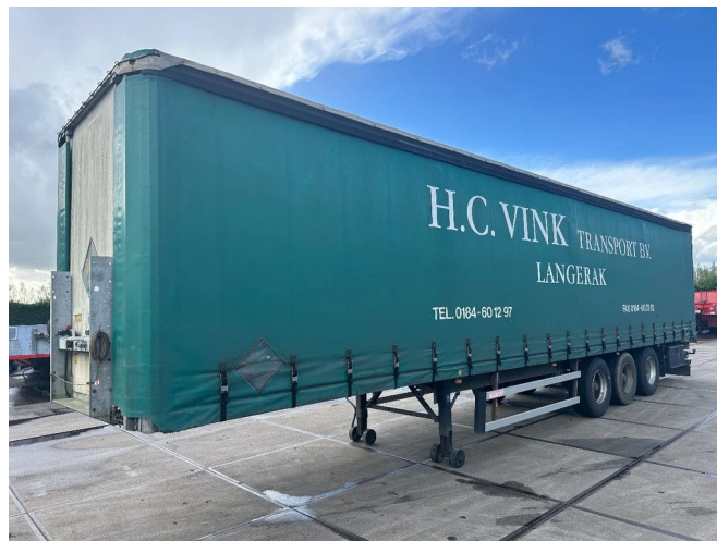
Groenewegen BPW DRUM BRAKES