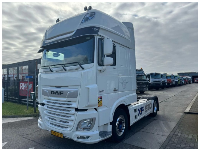
DAF XF 530 SSC 4X2 EURO 6 + RETARDER - YEAR 2022 ...