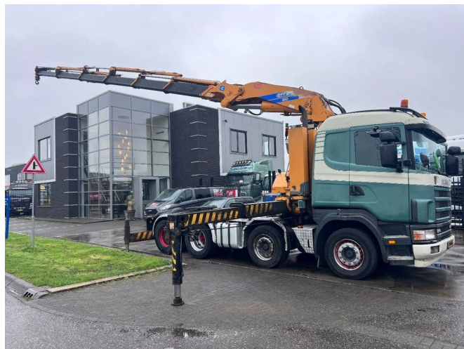
Scania R124-420 8X4 EURO 3 + EFFER 950/6S + 1 + REMOTE