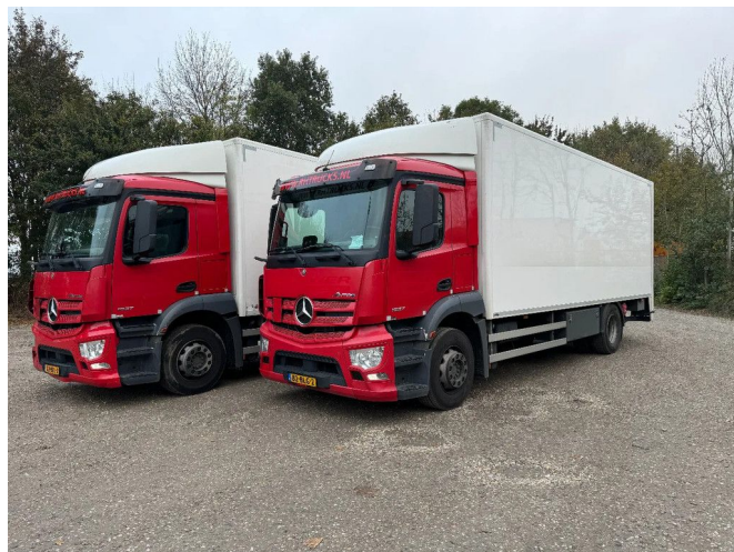
Mercedes-Benz Antos 1927 4X2 4 UNITS EURO 6 DHOLLA...